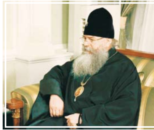
Архиепископ Курганский и Шадринский Константин в стенах Ташкентского епархиального управления

В Курганской епархии у меня нет даже личного кабинета, материальные условия необыкновенно стеснены. Мы соседствуем в маленьком кабинете вместе с секретарем епархии и заведующей кан-