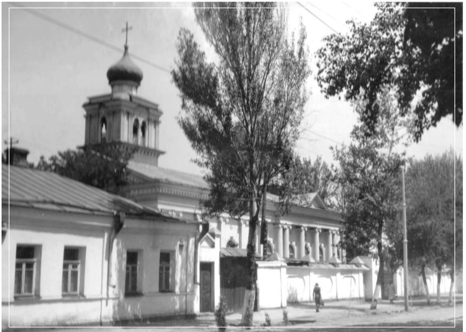
Ташкент. Свято-Успенский кафедральный собор. Середина XX столетия.