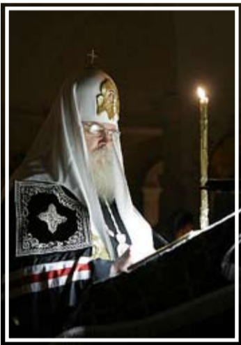
Чтение Великого покаянного канона Андрея Критского Святейшим Патриархом Алексием II

Согласно Типикону (Церковному уставу) Великий канон Андрея Критского читается только во время Великого поста: на великом повечерии понедельника, вторника, среды и четверга первой седмицы поста (разделен на четыре части, по одной на каждый день) и на утрене четверга пятой седмицы Великого поста полностью. Богослужение утрени четверга пятой седмицы Великого поста получило в народе название «Мариино, или Марьино стояние». Называется оно так потому, что на этой службе читается житие преподобной Марии Египетской.