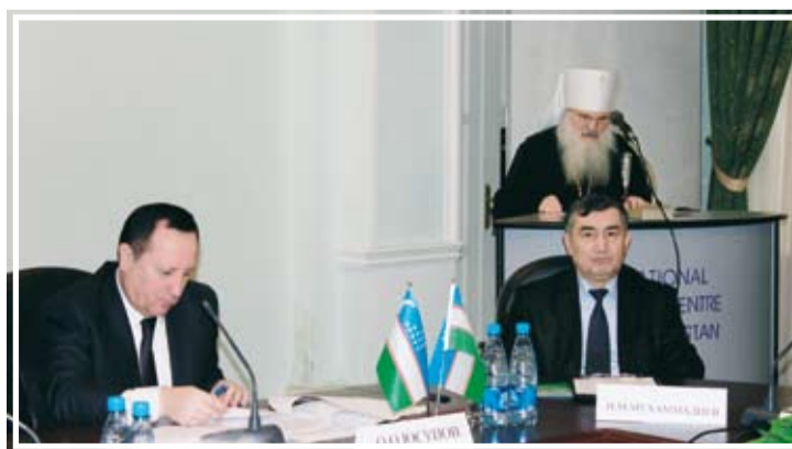
Митрополит Викентий выступает с докладом

осуществляется в обстановке подлинной толерантности, внимательного отношения к духовным ценностям в обществе, взаимопонимания и активного сотрудничества в области нравственного и духовного воспитания, преодоления греховных пороков современности.