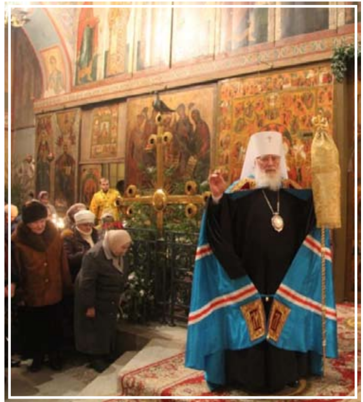
Первое богослужение владыки Льва в Новгородской епархии в качестве митрополита. 9 января 2012 год

церковные: 1983 г. – орден прп. Сергия Радонежского III степени; 2001 г. – орден блгв. кн. Даниила Московского II степени; 2006 г. – орден прп. Серафима Саровского II степени; 2011 г. – орден прп. Сергия Радонежского II степени. светские: государственный орден «Знак Почета»; государственный орден «За заслуги перед Отечеством» IV степени.