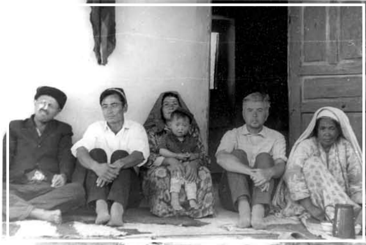
В Зармесе. Яккабагские горы. 1974 год.

а Церковь – дело старух. Мама промолчала, но напоследок сказала, – горбатого могила исправит. После этого случая все родственники стали ей говорить – теперь тебя уволят. Но ее не уволили. Повысили до старшей машинистки.