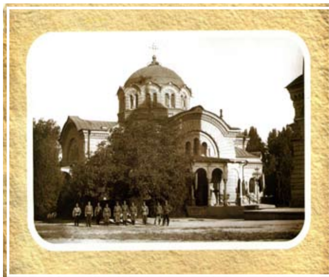
Ташкентский Спасо-Преображенский военный собор

Первым православным храмом Ташкента являлась небольшая Александро-Невская «церковь-часовня», однако она недолго оставалась единственным домом Божиим в столице Туркестана. Попечением фактического основателя епархии протоиерея Ан-