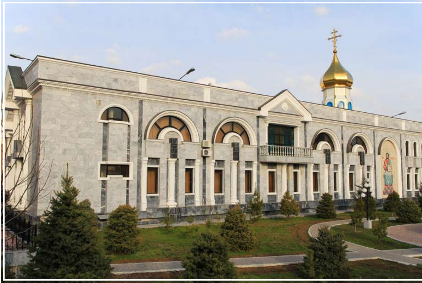
Ташкентское и Узбекистанское епархиальное управление