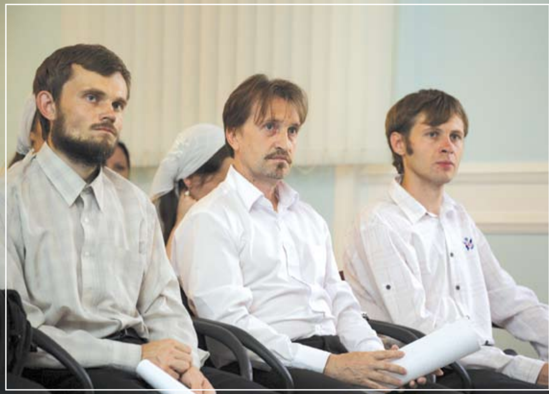
На торжественном выпускном акте Ташкентской духовной семинарии

Помните, у вас особое призвание – служение Богу. Вы должны поднимать нравственный уровень людей. Будьте добродетельными, подражая Господу и Спасу нашему Иисусу Христу. Желаю вам помощи Божией в дальнейших трудах.