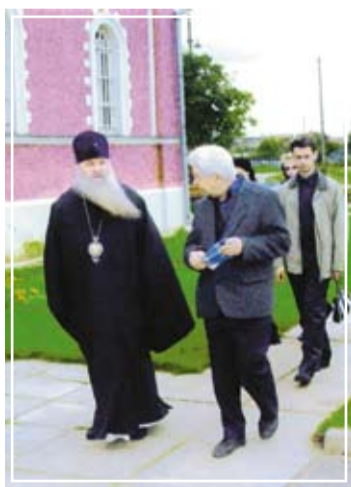
С митрополитом Волгоградским и Камышинским Германом (Тимофеевым). Храм Воскресения Слоущего. Сертякино, Моск. область, 2004 г.

– Митрополит Волгоградский и Камышинский Герман