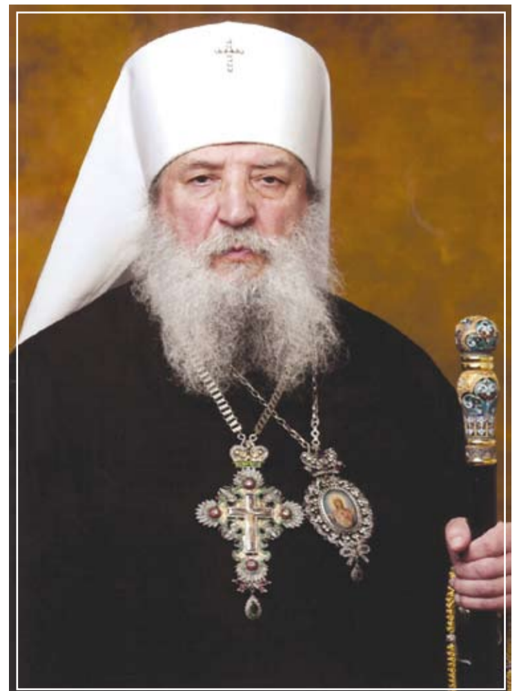
Первоиерарх РПЦЗ митрополит Лавр

«Радость озаряет наши сердца, — сказал Его Святейшество. — Свершилось историческое событие, которого ждали долгие годы. Восстановлено единство Церкви Русской. Это торжество драгоценно для Церкви, собирающей воедино чад своих, драгоценно для всего народа нашего. Преодолеваются церковные разделения — преодолевается и унаследованное со времен революции противостояние в обществе. Укрепляется Церковь — возрождается и наше отечество».