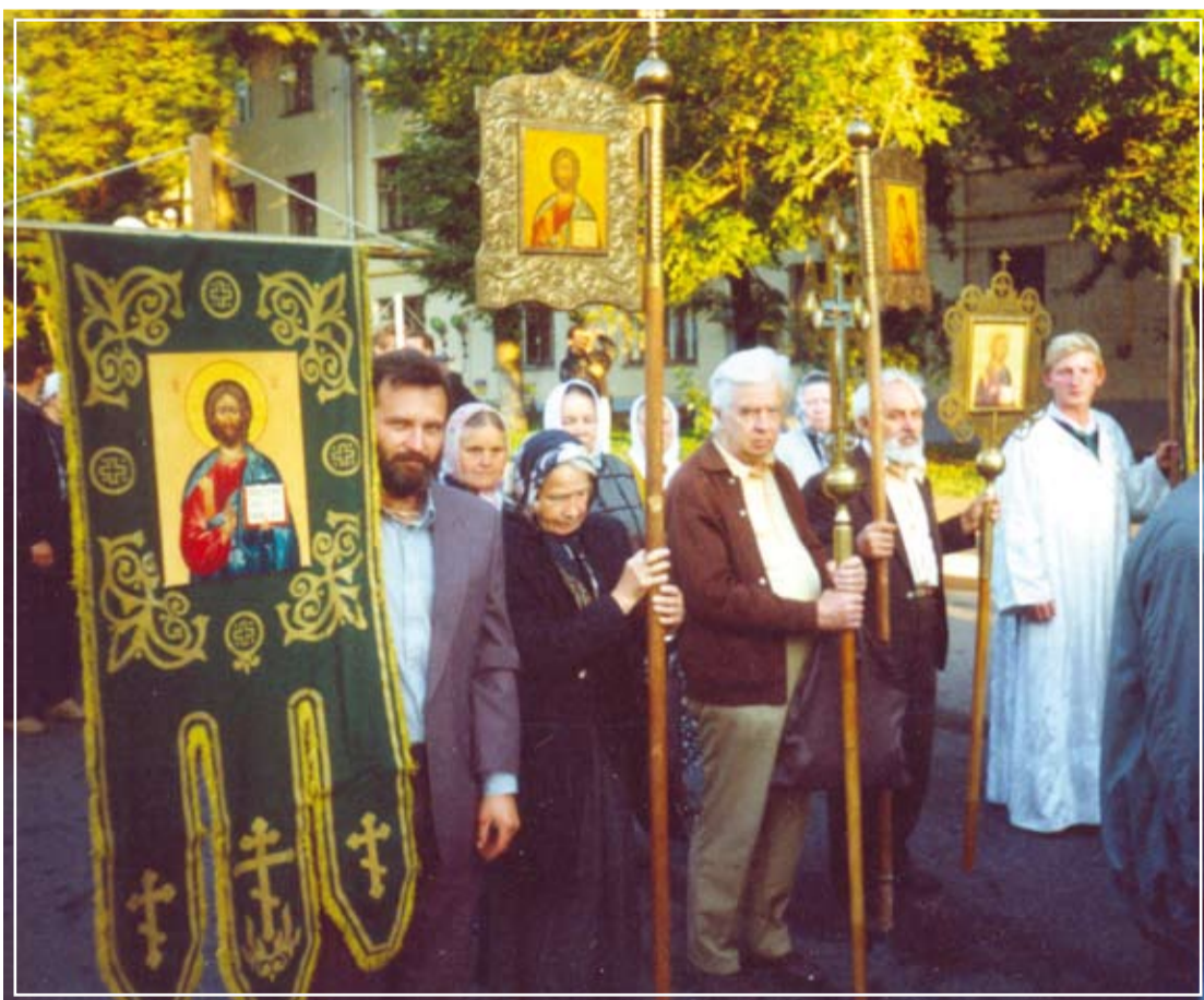
Крестный ход перед освящением Храма Христа Спасителя. Москва, 2000 г.