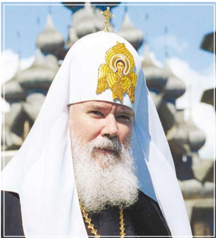
Патриарх Московский и всея Руси Алексий II

С. Ганьжин Журнал Московской Патриархии № 6 2007 год